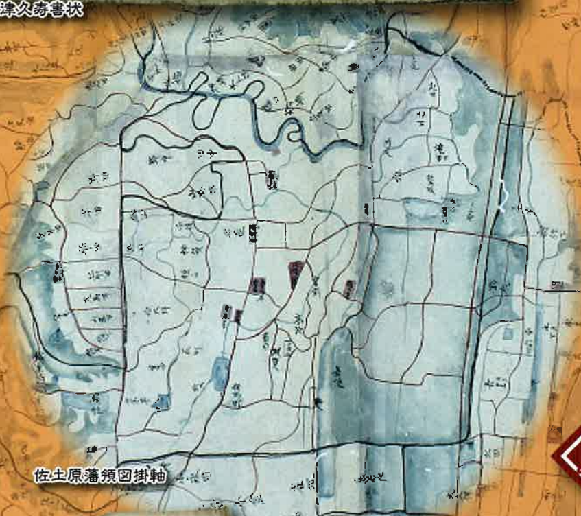
佐土原藩領図掛軸